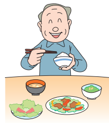
十分な休養と バランスのとれた栄養